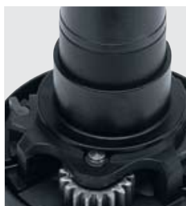
I winch Aluminium Radial 20 hanno una boccia in composito per controllare più agevolmente i bassi carichi sulle imbarcazioni di dimensioni contenute.

I winch per le imbarcazioni più piccole sono disponibili a 1 velocità. I modelli dotati di self-tailing dal 60 ed oltre sono disponibili a 2 o 3 velocità.